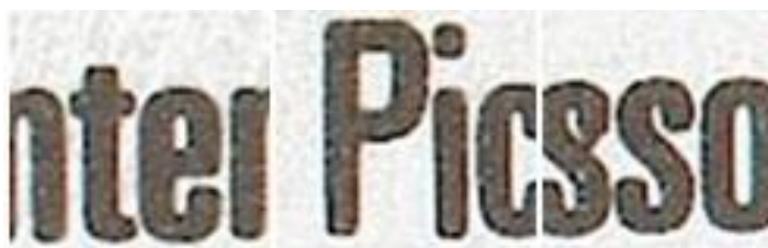
Cabecera de Pliego